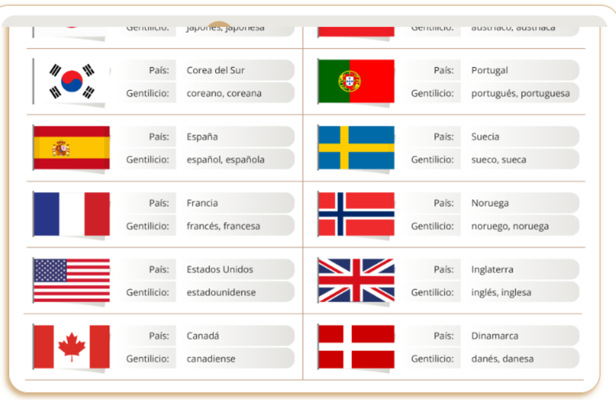
Figura 1. Gentilicios por nacionalidad.

Para formar una oración y decir tu nacionalidad, es necesario aprender el verbo "ser".