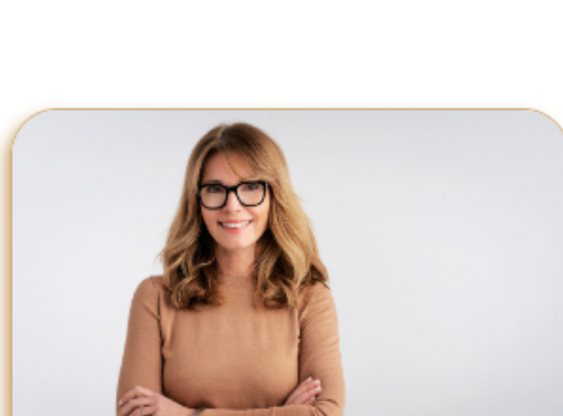
La Sra. Gutiérrez no es china.

Ahora es tu turno. Piensa en algunas oraciones negativas utilizando el verbo "ser" conjugado y diferentes gentilicios.