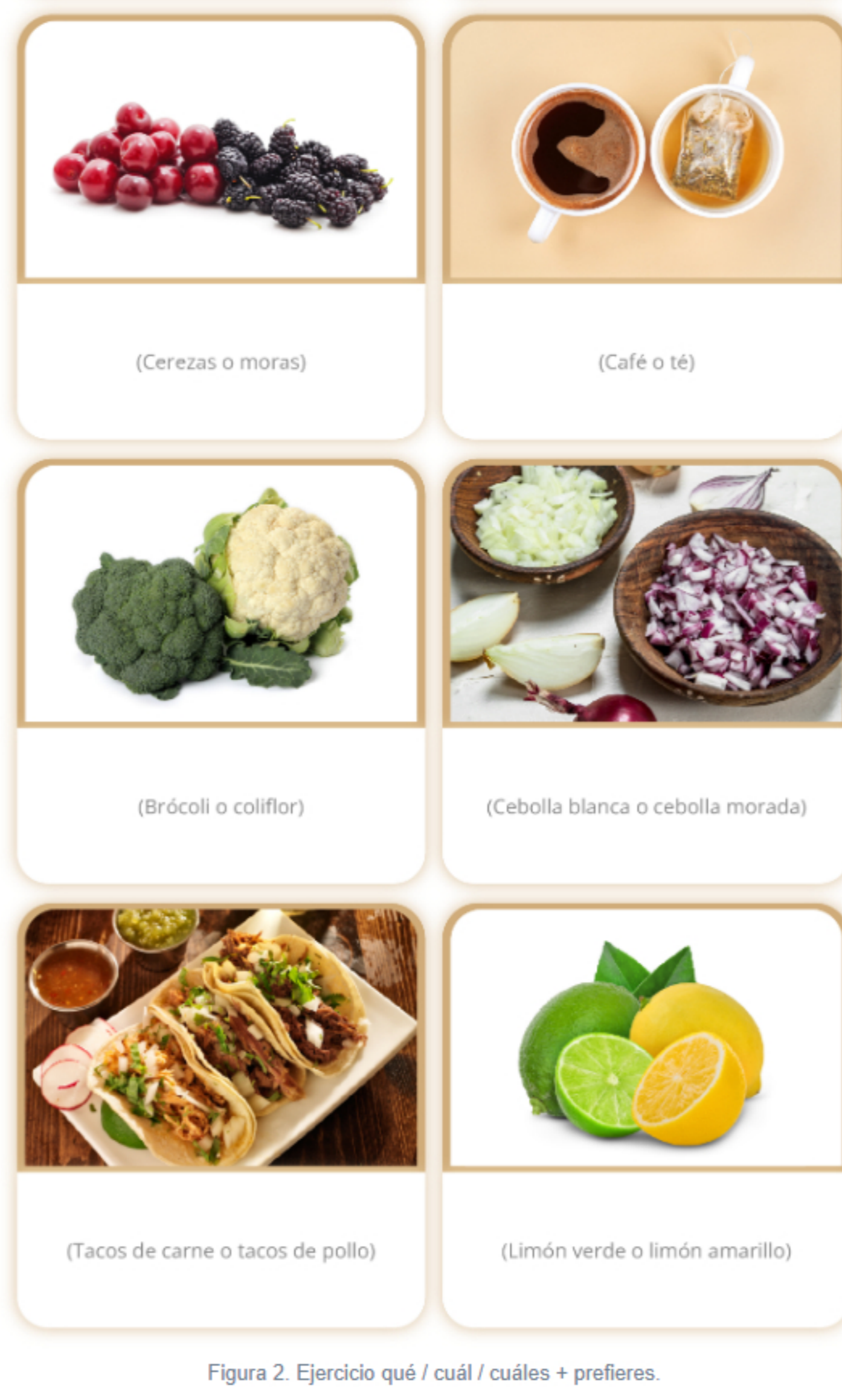
Figura 2. Ejercicio qué / cuál / cuáles + preferir.

Observa las siguientes imágenes y escribe una pregunta para cada una usando los interrogativos qué , cuál o cuáles y el verbo preferir . Después, contesta tus propias preguntas.