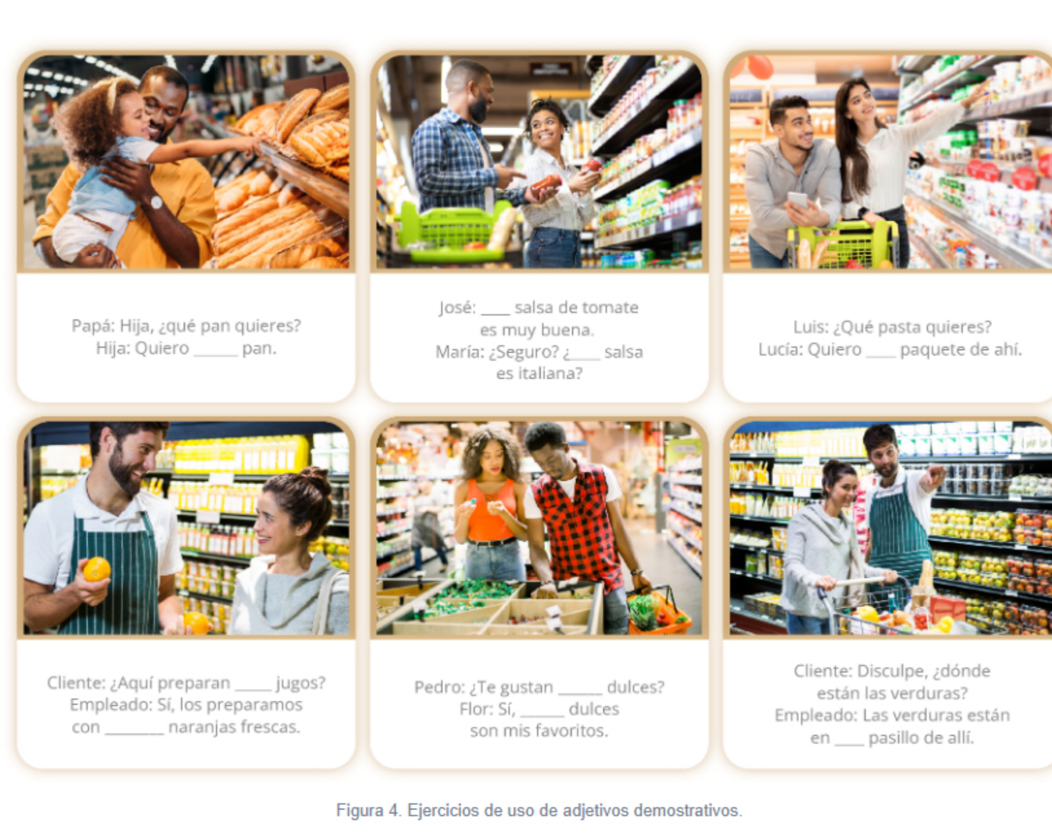
Figura 4. Ejercicios de uso de adjetivos demostrativos.

Observa las imágenes y completa los breves diálogos con el adjetivo demostrativo correcto (este, esta, estos, estas, ese, esa, esos, esas, aquel, aquellos, aquella, aquellas).