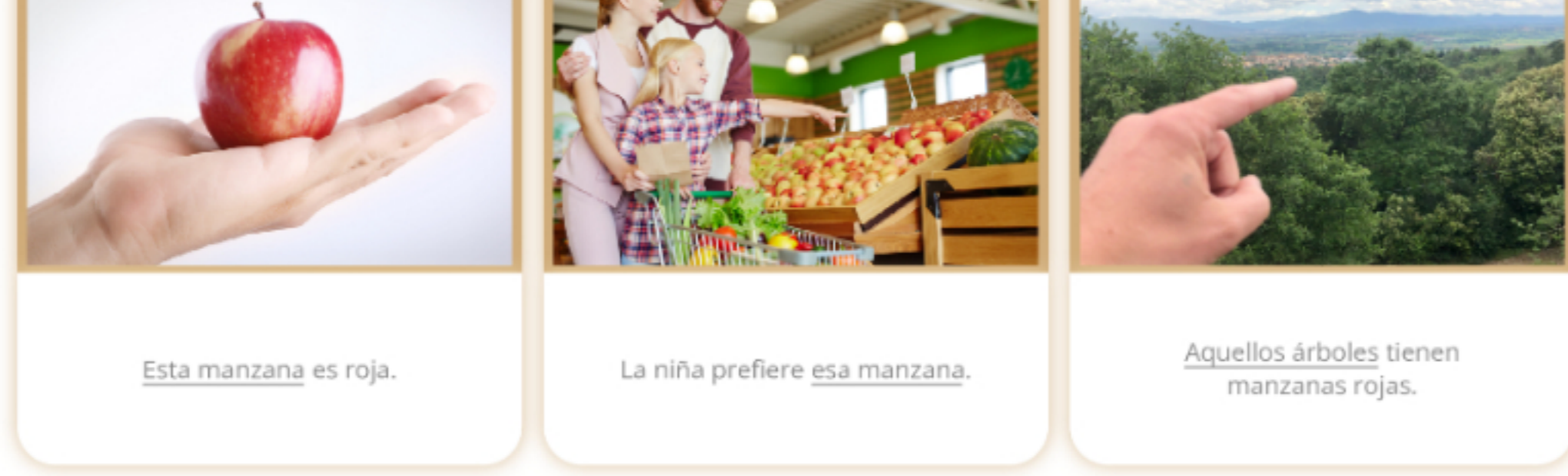
Figura 3. Ejemplos de uso de adjetivos demostrativos.

Como puedes ver en los ejemplos, los adjetivos demostrativos se usan siempre antes de un sustantivo.