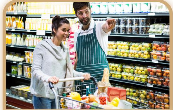
“En aquel pasillo están las verduras”.

Como puedes ver en los ejemplos, los adjetivos demostrativos se usan siempre antes de un sustantivo .