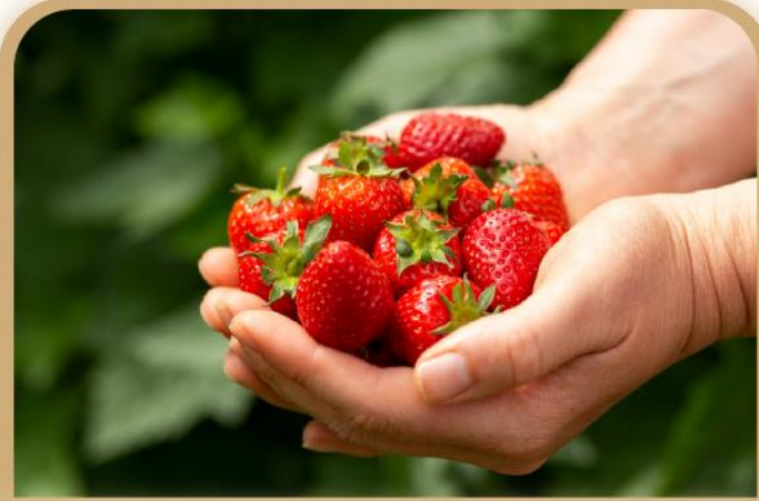
Estas fresas están maduras.