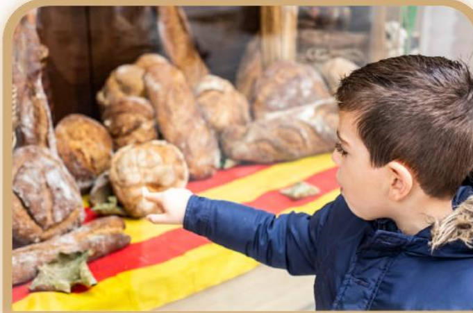
El niño quiere ese pan .