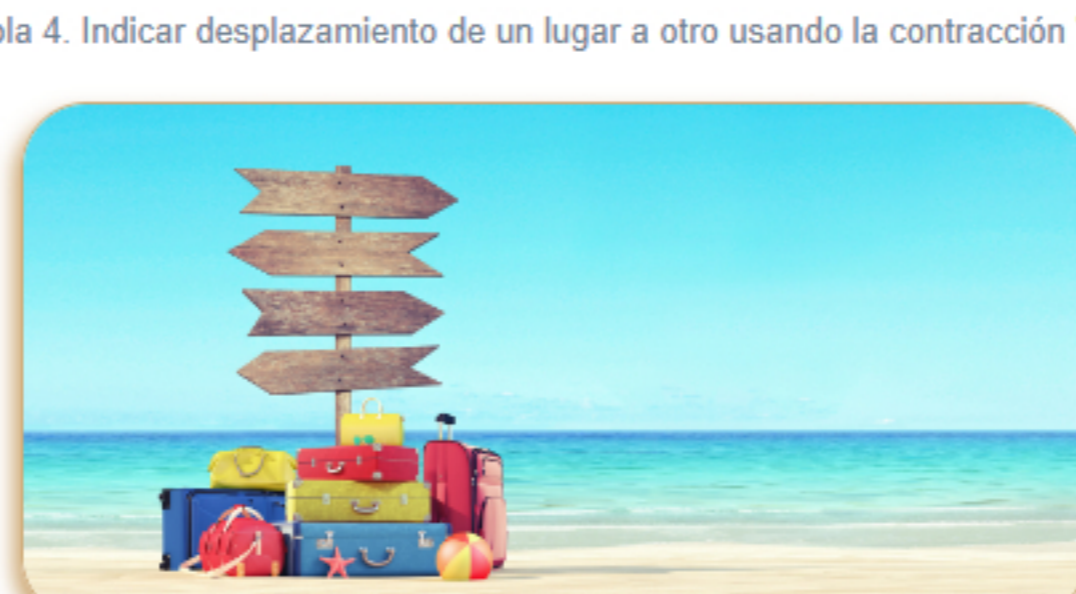
Tabla 4. Indicar desplazamiento de un lugar a otro usando la contracción "del".