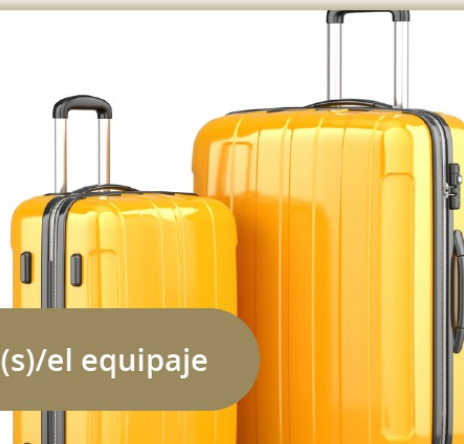
La(s) maleta(s)/el equipaje