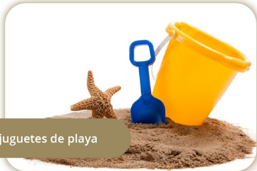
Los juguetes de playa