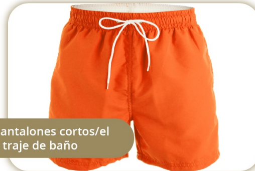
Los pantalones cortos/el traje de baño