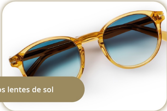
Los lentes de sol