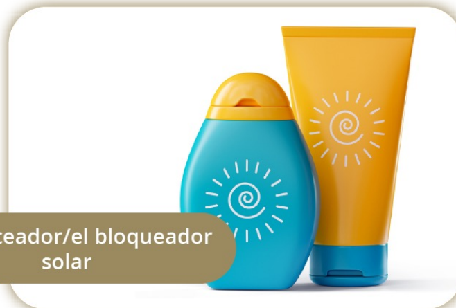
El bronceador/el bloqueador solar