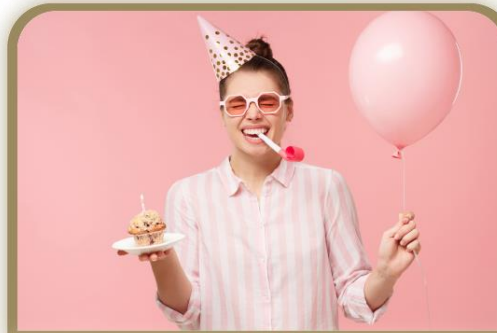
El cumpleaños/la cumpleañera