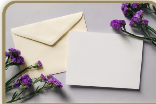
La invitación/la tarjeta de felicitación