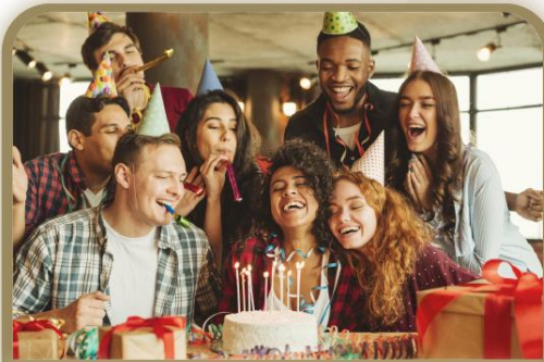
El cumpleaños/el aniversario /la celebración