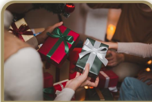
El regalo/el obsequio