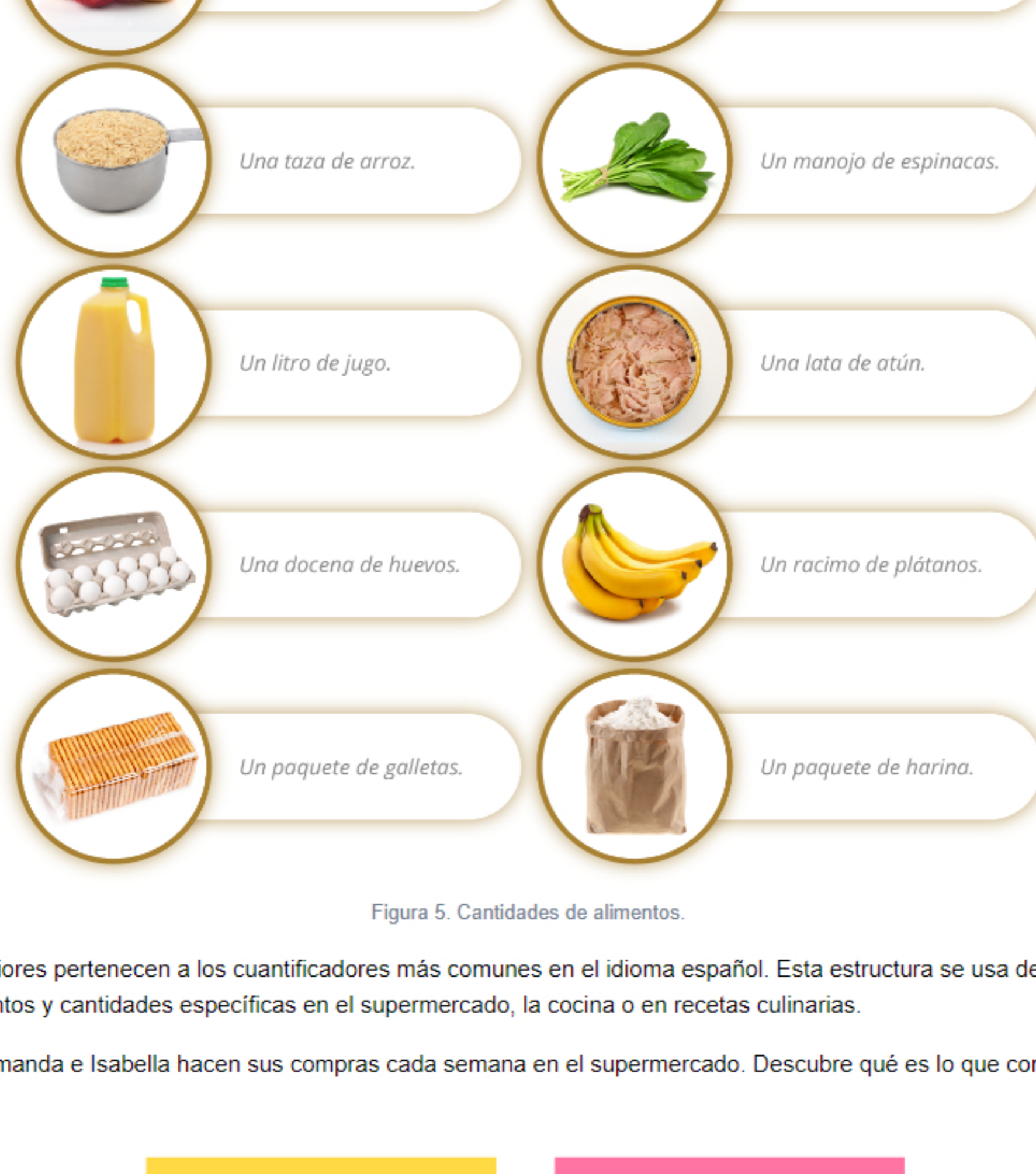
Figura 5. Cantidades de alimentos.

Esta estructura se emplea para indicar la cantidad de un alimento específico que se desea comprar, preparar o consumir. Revisa el gráfico con algunos ejemplos de cómo utilizar esta estructura: