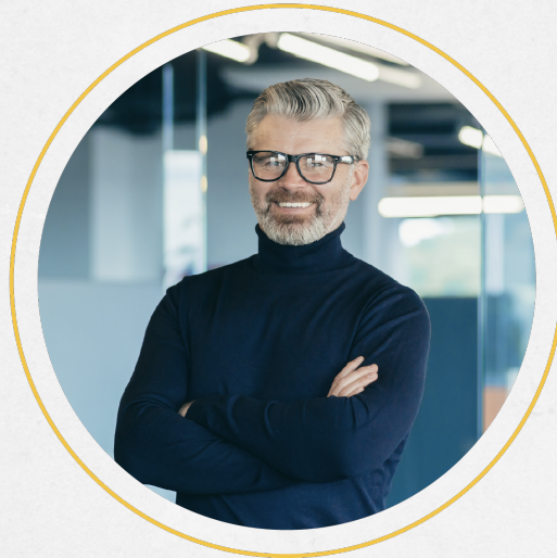
Liderazgo situacional de Hersey Blanchard