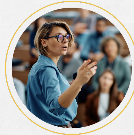
Teoría de Fiedler