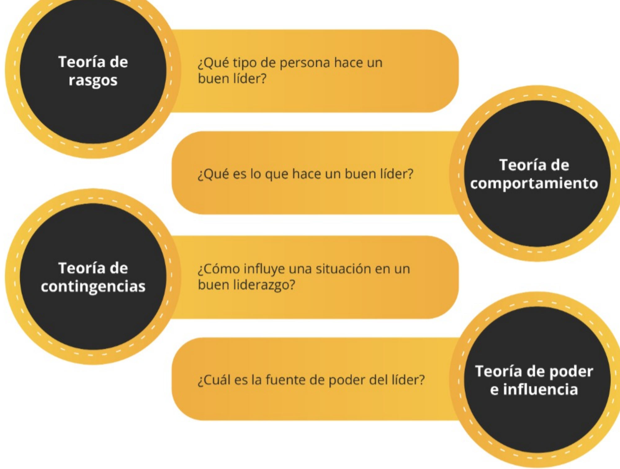
Figura 1. Teorías del liderazgo.

Son muchas las teorías de liderazgo que se han desarrollado en las últimas décadas, sin embargo, se puede colocar a la mayoría dentro de cuatro categorías principales. Pon mucha atención a esta categorización porque lograr entender cada una de estas cuatro teorías te ayudará a ser un mejor líder, sabiendo bien cuándo utilizar cada enfoque de acuerdo con la situación particular que se te presenta.