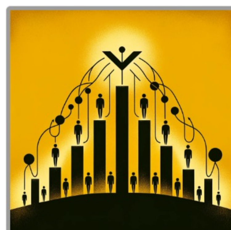
Imagen obtenida y editada de https://openai.com/ Solo para fines educativos.

Para comprender mejor la Ley del Tope observa detenidamente la siguiente imagen, donde el eje horizontal representa el esfuerzo dedicado por una persona para alcanzar un objetivo, el eje vertical representa su capacidad de liderazgo, y el área bajo la curva (el área sombreada) representa el valor de la eficacia alcanzada.