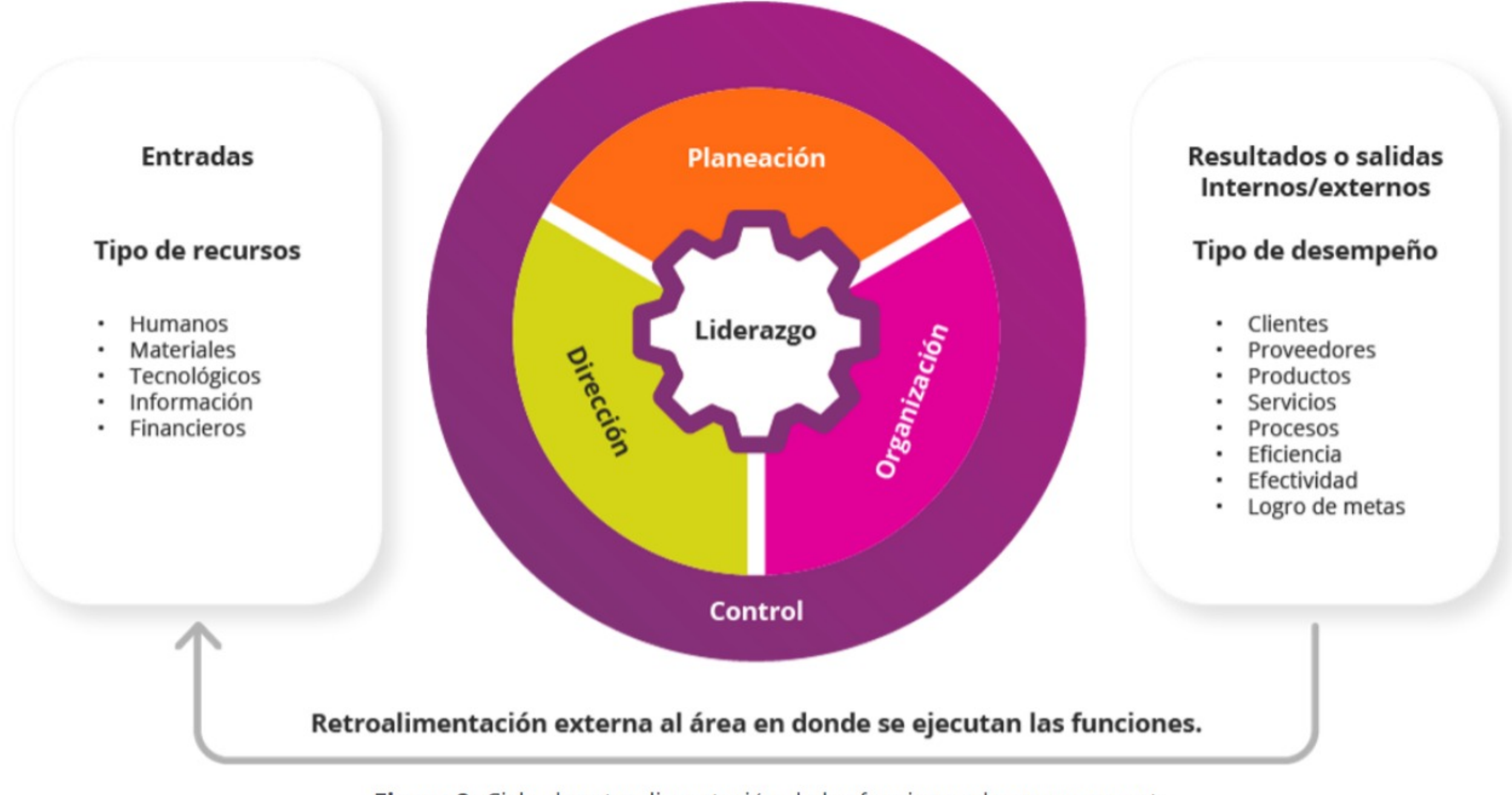
Figura 2. Ciclo de retroalimentación de las funciones de management.

Para la aplicación del management es importante considerar las cuatro funciones base (planeación, organización, dirección y control), las cuales no necesariamente se ejecutan de forma lineal. Aunque inicialmente puede ser así (forma lineal), existen procesos de retroalimentación que mueven la dirección a planeación mientras se sigue el monitoreo, lo cual forma un ciclo entre la planeación, la organización y la dirección (figura 2).