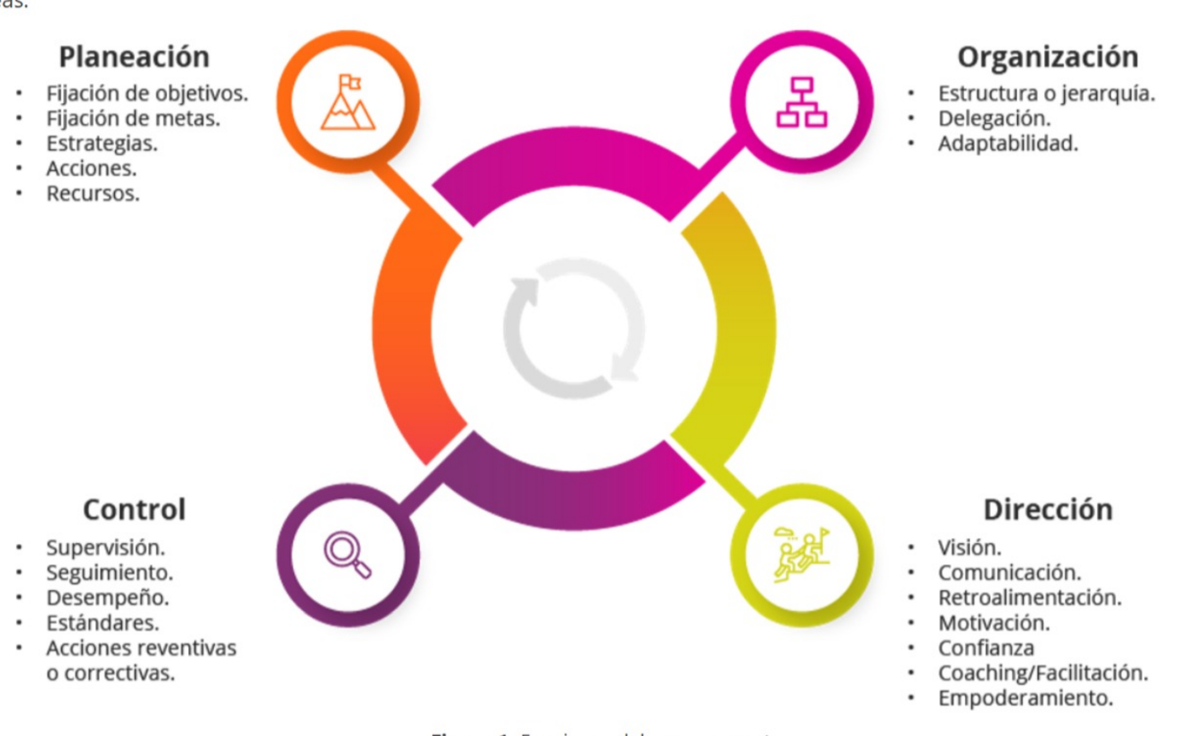
Figura 1. Funciones del management.

Por esta razón, el manager debe basarse en cuatro grandes funciones, las cuales se muestran en la siguiente figura, en donde se distinguen las etapas y las principales tareas.