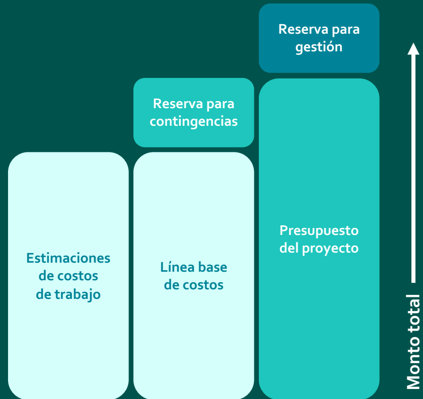
Creación del presupuesto

El presupuesto se desarrolla partiendo de las estimaciones que se acuerdan para el mismo. Es importante mencionar que el presupuesto del proyecto debe incluir fondos de reserva para contingencias, de manera que se tome en cuenta la incertidumbre.