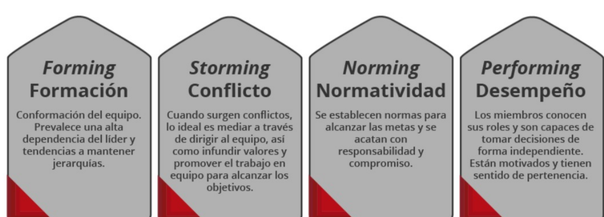
Diagrama 3. Fases del desarrollo de un equipo de trabajo.

Pareja (2019) menciona las siguientes fases del desarrollo de un equipo de trabajo: