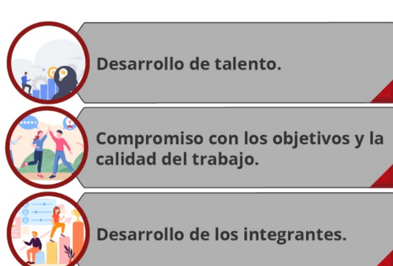
Diagrama 1. Enfoques de un equipo de alto desempeño (EAD).

Por otro lado, los EAD buscan el logro de metas a través de los siguientes enfoques (Dueñas, 2018):