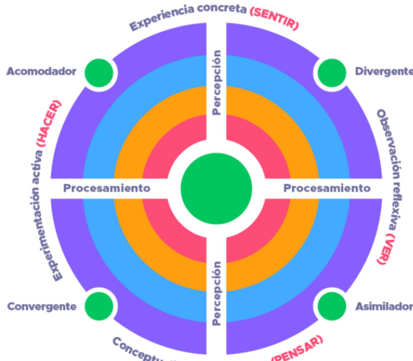
Imagen tomada para fines educativos. Newport School. Identifica tu estilo de aprendizaje según Kolb.

Con base en estas diferencias, y combinando las formas de percibir y procesar la información/ experiencia, Kolb amplió su ciclo de aprendizaje experiencial. Estas preferencias ahora sirven como base para los cuatro (4) estilos de aprendizaje de Kolb.