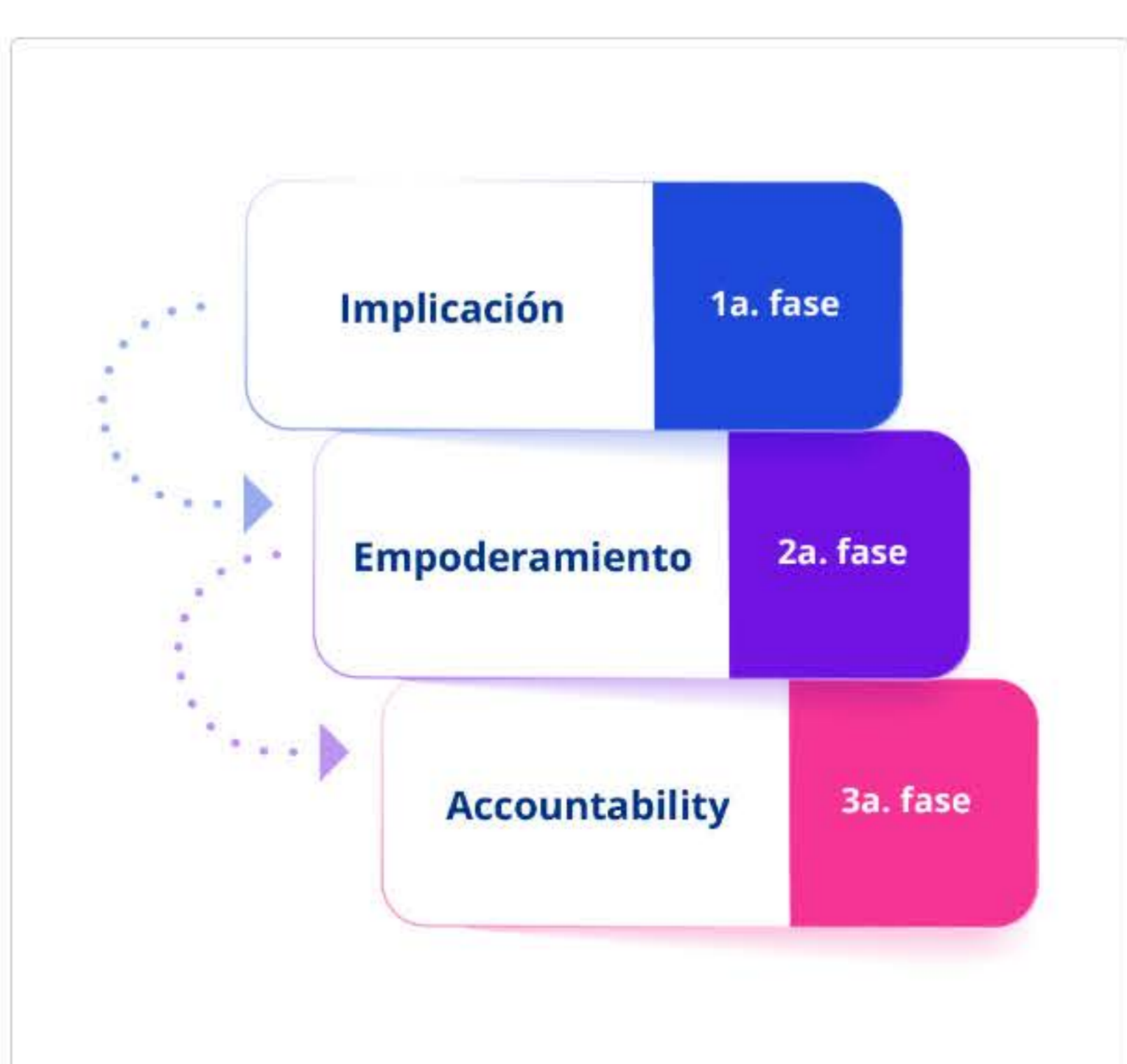
Figura 2. Fases de accountability.

Debes considerar que este cambio no es repentino, ni se logra por decreto en una organización. Debe darse primero de forma individual. Para que una persona que pertenece al equipo de trabajo se mueva hacia el accountability deberá seguir tres etapas o fases, que son la implicación , el empoderamiento y, por último, el accountability (Browning, 2021).