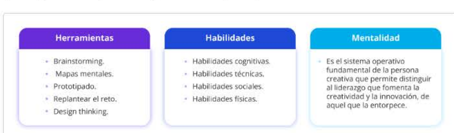
Figura 3. Pilares en liderazgo de innovación.

Para un liderazgo de innovación efectivo, se requieren tres pilares según Schnarch (2020):