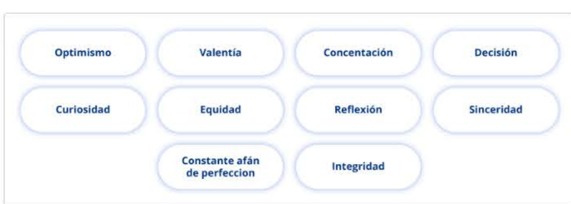
Figura 2. Diez principios del liderazgo creativo.

A continuación, se presentan diez principios del liderazgo creativo según Iger (2022):