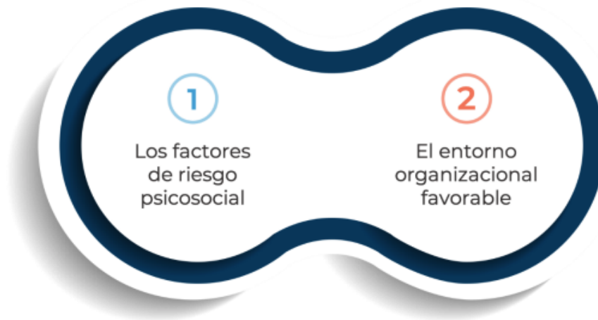
Esquema obligaciones del patrón y del trabajador.