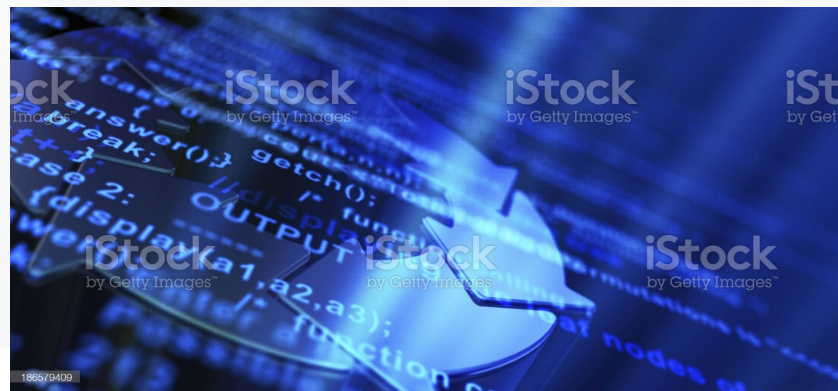
ID de la fotografía:186579409

Antes, escribir programas computacionales significaba usar el lenguaje máquina. Hoy, la traducción automática de un lenguaje de alto nivel al lenguaje máquina es extremadamente necesario para que las computadoras sean útiles para una mayor cantidad de usuarios.