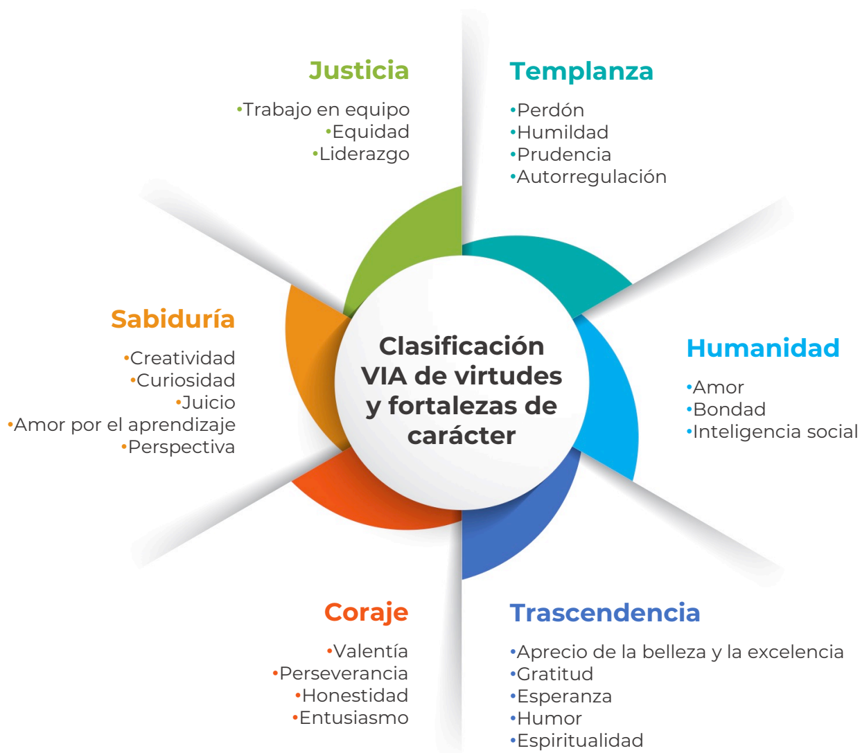
Figura 1. Clasificación VIA de virtudes y fortalezas de carácter.

Fuente: Peterson, C., y Seligman, M. (2004). Character Strengths and Virtues. A Handbook and Classification . Estados Unidos: American Psychological Association.