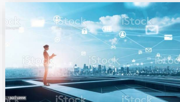
ID de la fotografía:1300749998

Además, comprendiste cómo la programación orientada resulta útil para representar conceptos y situaciones del mundo real, permitiendo entender la lógica detrás del código y facilitando la comprensión del mismo, con el potencial de extenderlo a la creación de programas que aborden prácticamente cualquier problema de forma eficaz.