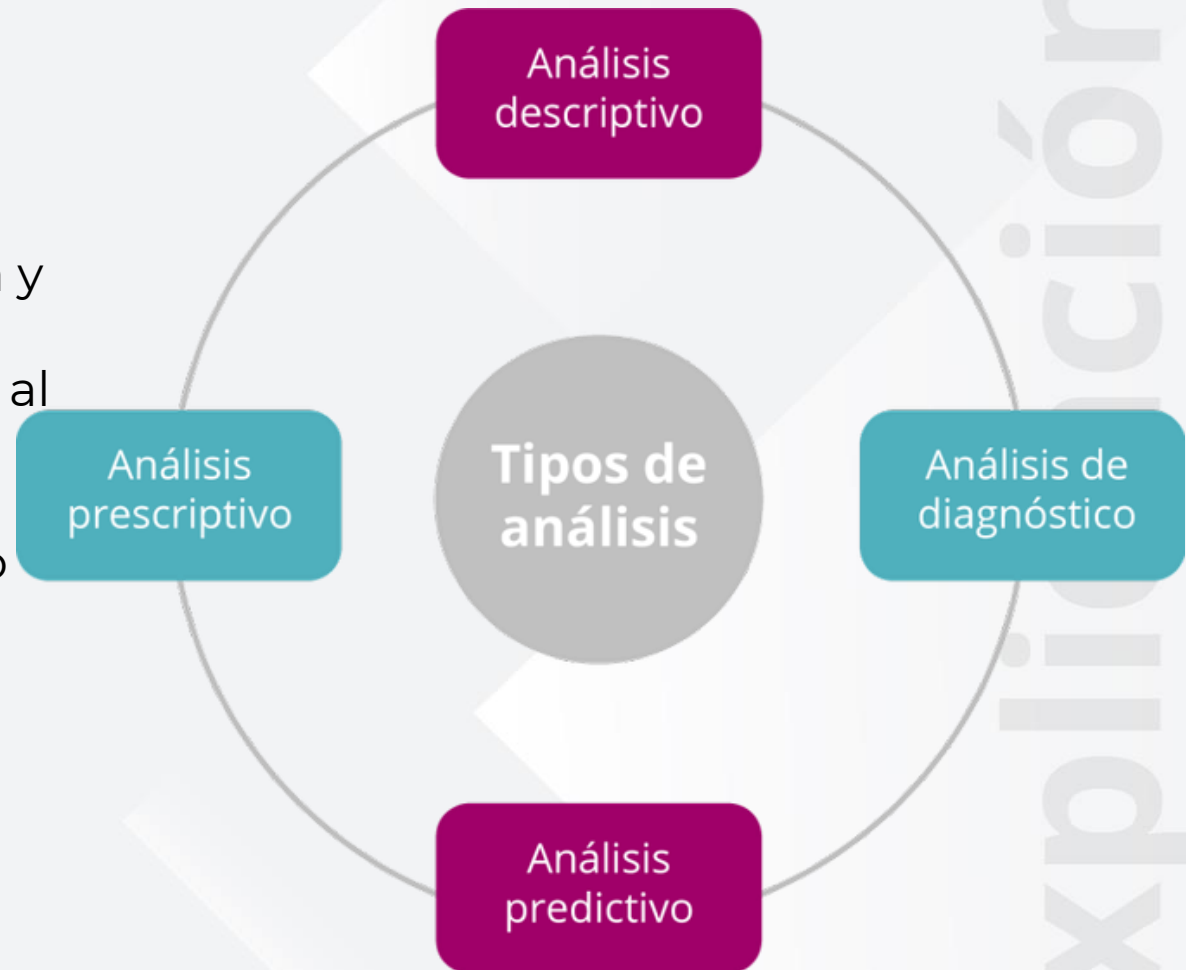
Figura 2. Tipos de análisis.