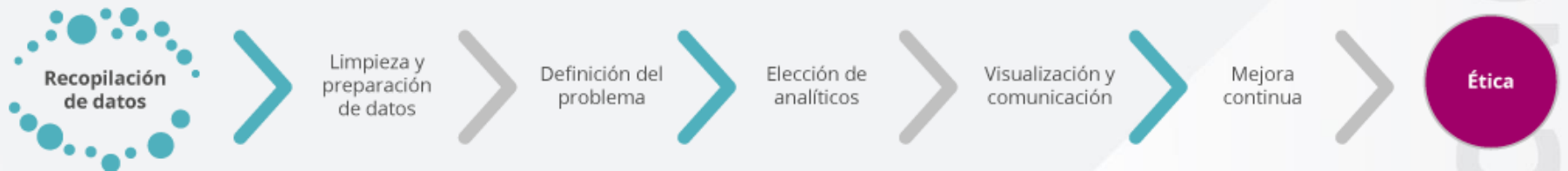
Figura 1. Elementos clave en HR Analytics.