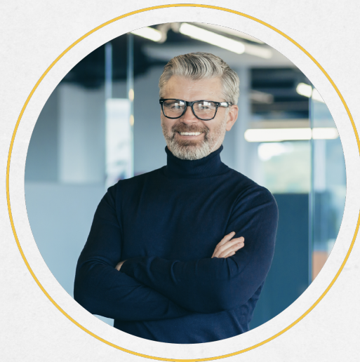
Liderazgo situacional de Hersey Blanchard