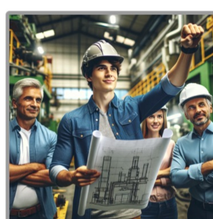
Imagen obtenida y editada de https://openai.com/ Solo para fines educativos.

¿Cuál es el objetivo en este tema? Comprender los elementos clave para desarrollarse como líder, con el fin de desatar el potencial que se posee para dejar una huella significativa y transformar la sociedad en la que se interactúa.