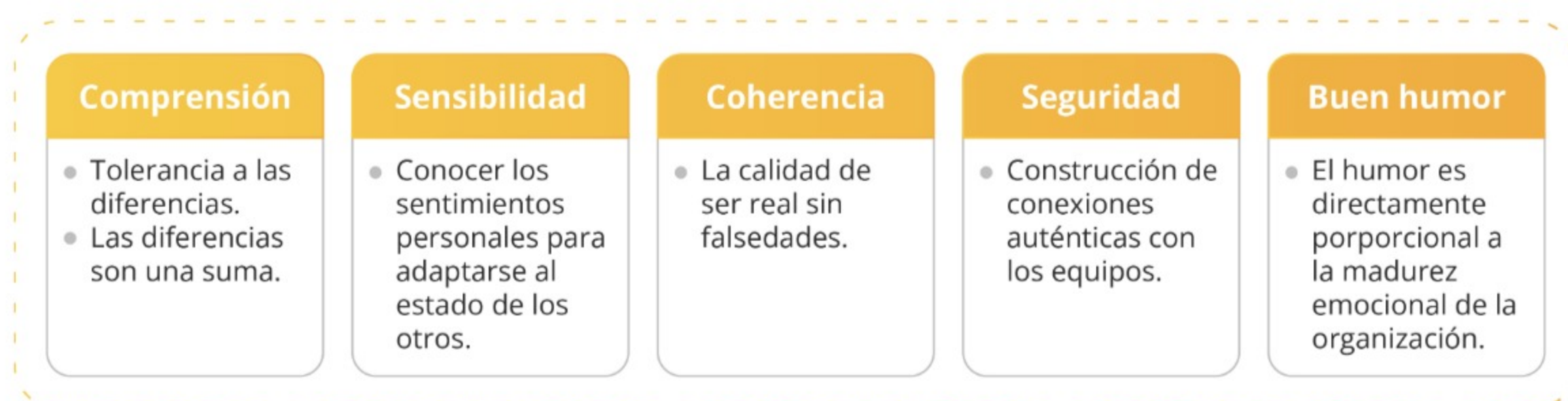
Figura 2. Cinco cualidades de liderazgo.

De acuerdo con Torre (2023), el liderazgo significa crear conexiones positivas con los demás. Este autor destaca cinco cualidades para hacerlo: