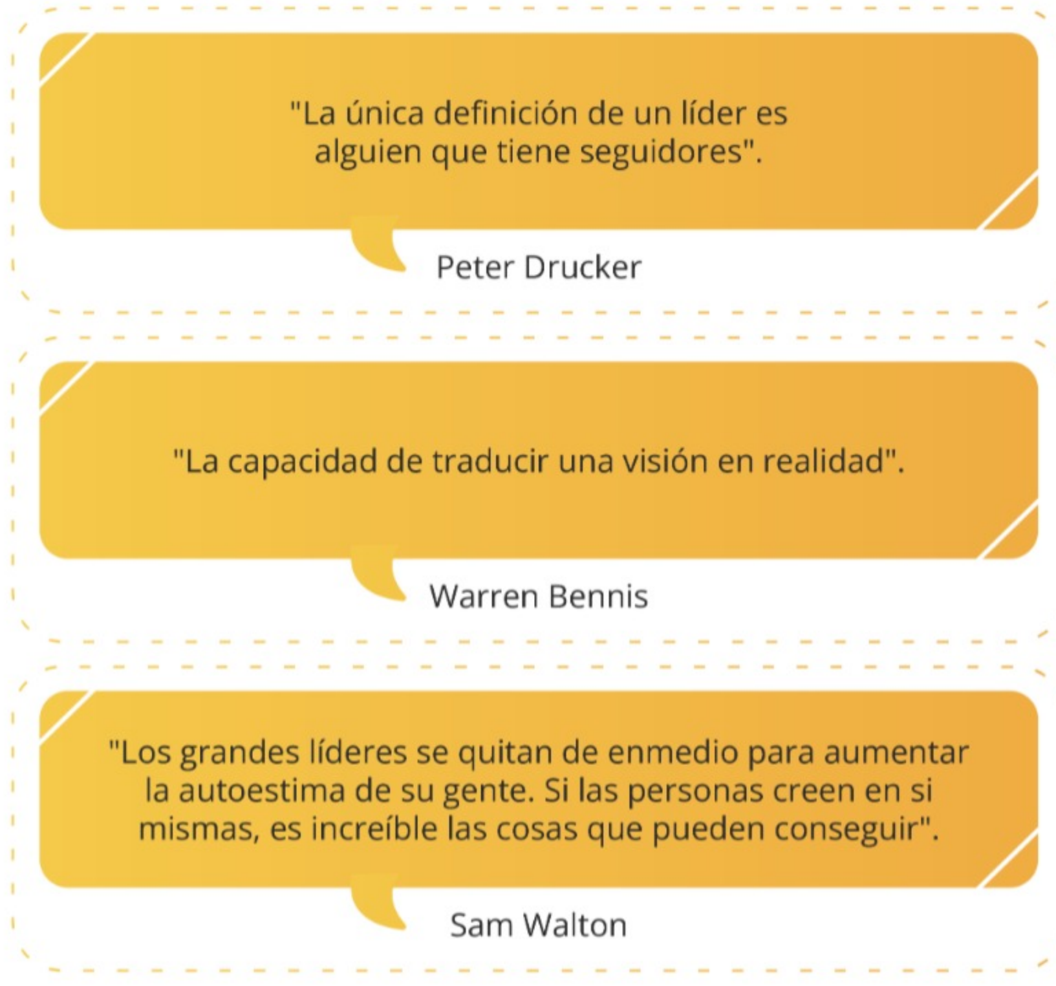
Figura 1. Tres frases de liderazgo inspiradoras.