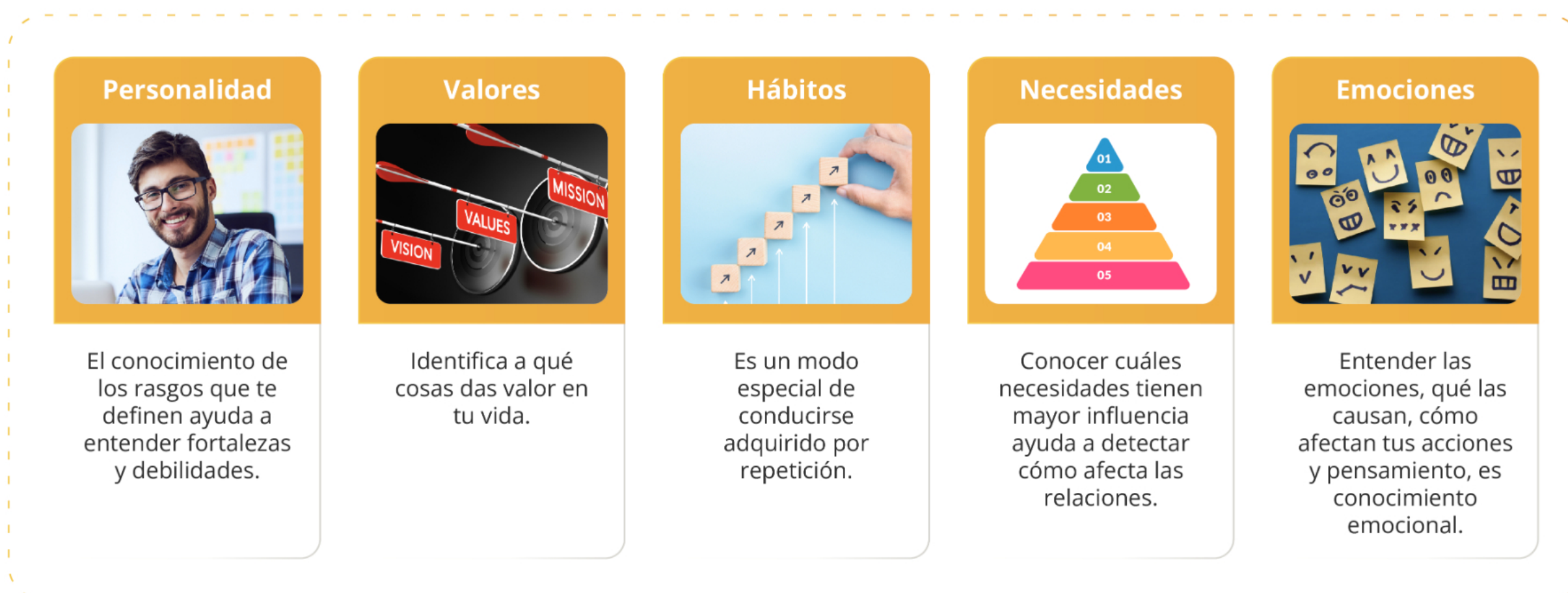
Figura 1. Áreas clave del autoconocimiento.