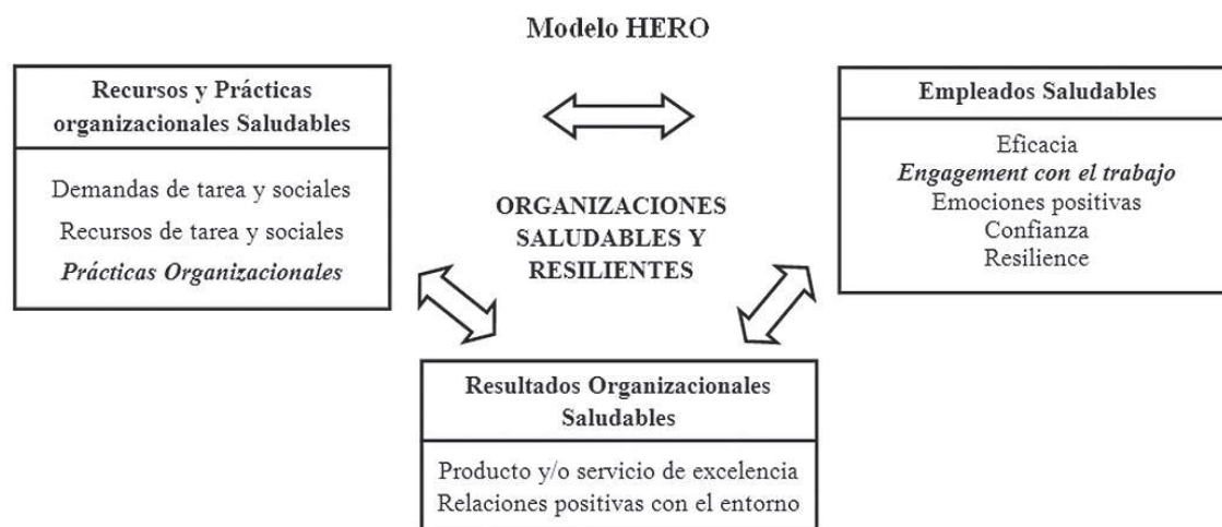
Fig. 1. Modelo HERO ( Healthy and Resilient Organizations Model ). Adaptado de Salanova, Llorens, Cifre & Martínez, 2012

El Modelo HERO constituye un modelo heurístico y teórico que permite integrar resultados basándose en evidencia teórica y empírica que proviene de las investigaciones sobre estrés laboral, DRH, comportamiento organizacional y desde la Psicología de la Salud Ocupacional Positiva (Llorens, Del Líbano & Salanova, 2009). De acuerdo con este modelo, una organización saludable y resiliente combina tres componentes clave que interactúan entre sí: (1) recursos y prácticas organizacionales saludables (e.g., recursos laborales, prácticas organizacionales saludables), (2) empleados saludables (e.g., creencias de eficacia, confianza organizacional, engagement con el trabajo) y (3) resultados organizacionales saludables (e.g., desempeño) (Salanova y cols., 2012). Dado que se trata de un modelo heurístico, debe ponerse a prueba a través de las relaciones específicas entre algunas variables de los componentes clave. Como consecuencia, en el presente estudio, nos centramos en dos componentes específicos del Modelo HERO: (1) recursos y prácticas organizacionales saludables (en concreto en las prácticas organizacionales saludables) y (2) empleados saludables (en concreto en el engagement con el trabajo).