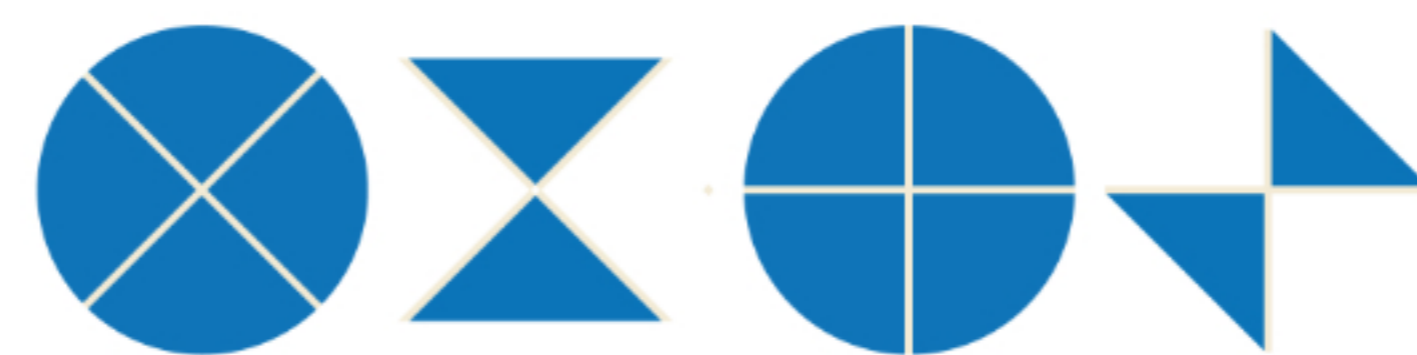
Figura 2. Solución de la sucesión de figuras.

En este sentido, algunas respuestas no contienen números, sino figuras, así que necesitas usar tu imaginación para descifrar el ejercicio.