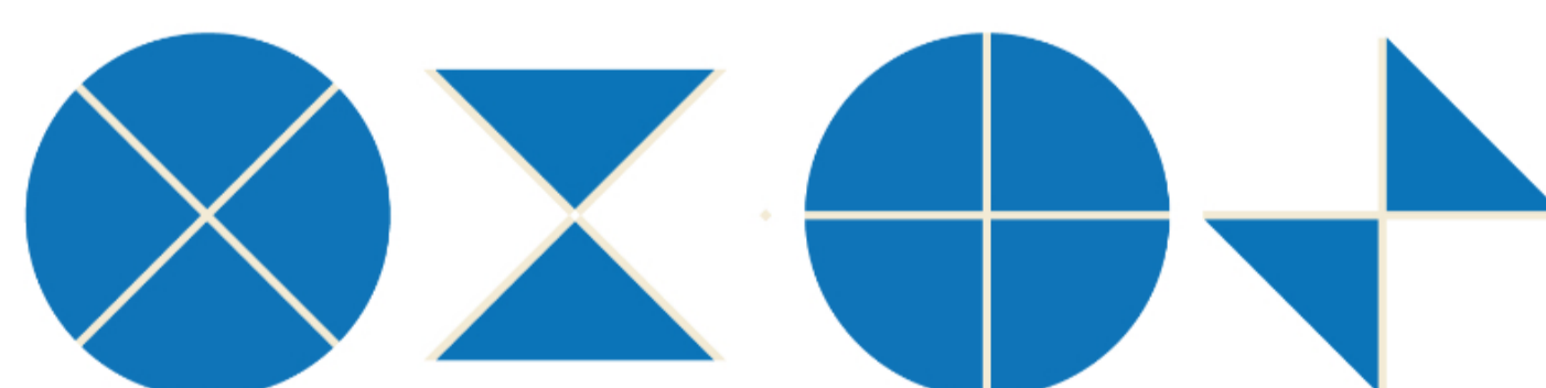
Figura 2. Solución de la sucesión de figuras.

En este sentido, algunas respuestas no contienen números, sino figuras, así que necesitas usar tu imaginación para descifrar el ejercicio.