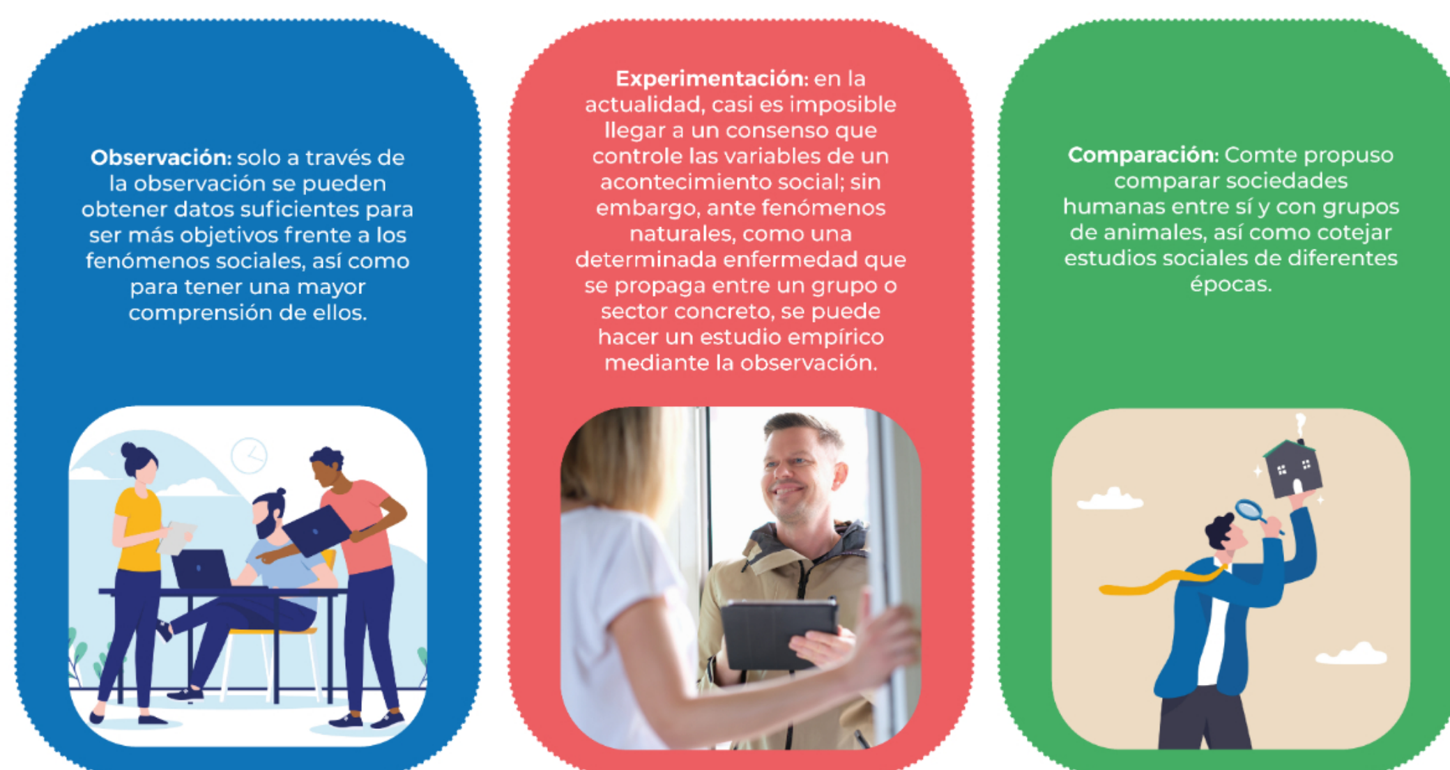
Figura 1. Métodos sociológicos.

Surgió en el siglo XIX, de la mano de Augusto Comte y sus seguidores, quienes afirmaban que el único conocimiento válido se obtiene gracias al método científico (Grudemi, 2022). A principios del siglo XIX, la sociología se estableció como ciencia, cuyo objeto de estudio se centró en la vida social del hombre, ya sea en grupos o sociedades; de esta manera, se buscaba un mejor funcionamiento de la sociedad y, a la vez, impulsar el positivismo. Para Comte, el sistema era corrupto y cruel, pues destinaba riquezas y bienes materiales solo a las clases privilegiadas; por tanto, con la intención de evitar otra revolución, planteó tres métodos sociológicos: