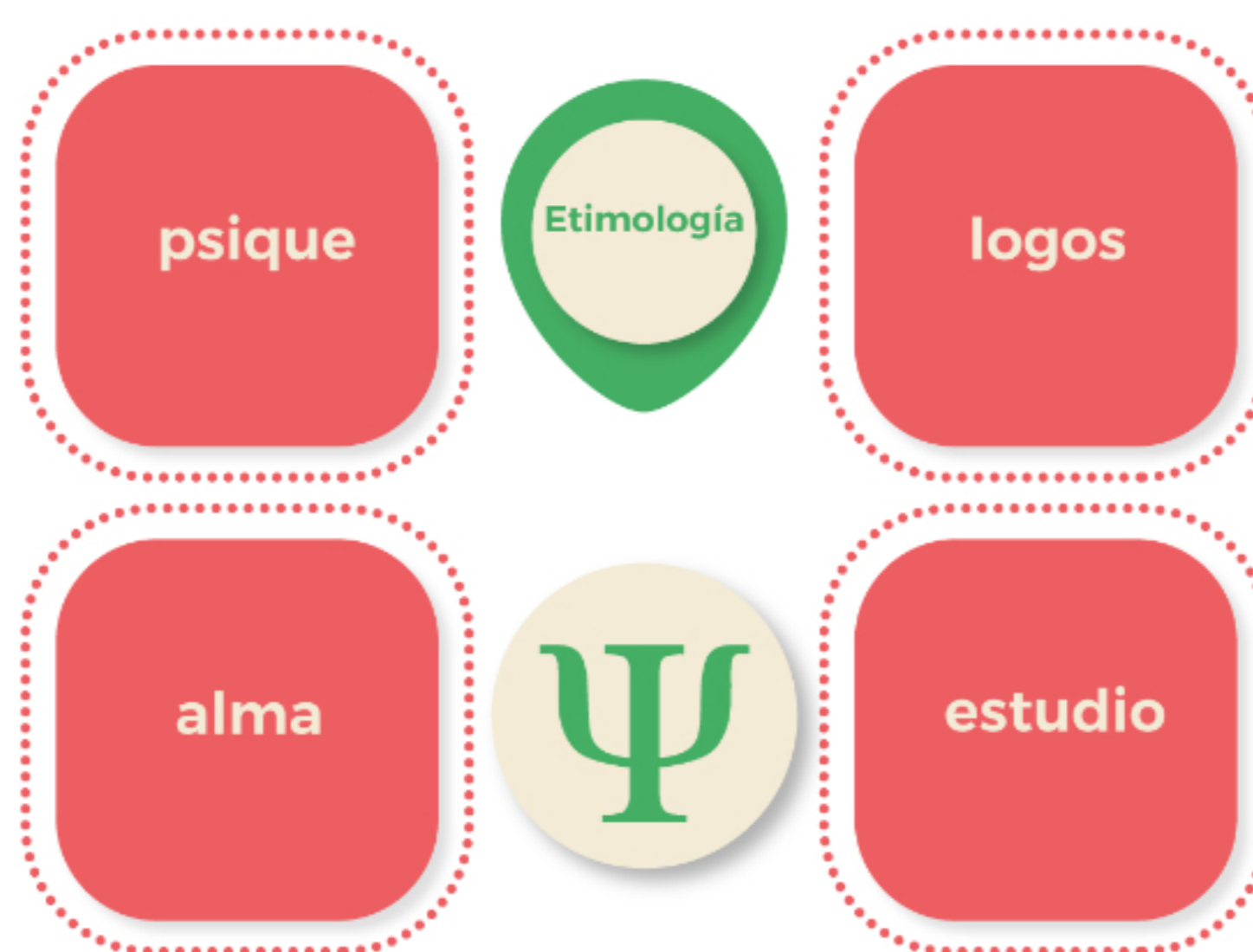
Figura 1. Etimología de la palabra psicología.

Aristóteles escribió la primera obra sobre psicología, titulada Acerca del alma , donde aborda temas como la sensación, percepción, memoria e inteligencia. En ella, se establece una distancia con el idealismo platónico, el cual implica un dualismo entre mente y cuerpo, ya que para Aristóteles la mente no puede existir sin el cuerpo; más adelante, el filósofo francés René Descartes retomará esta premisa.